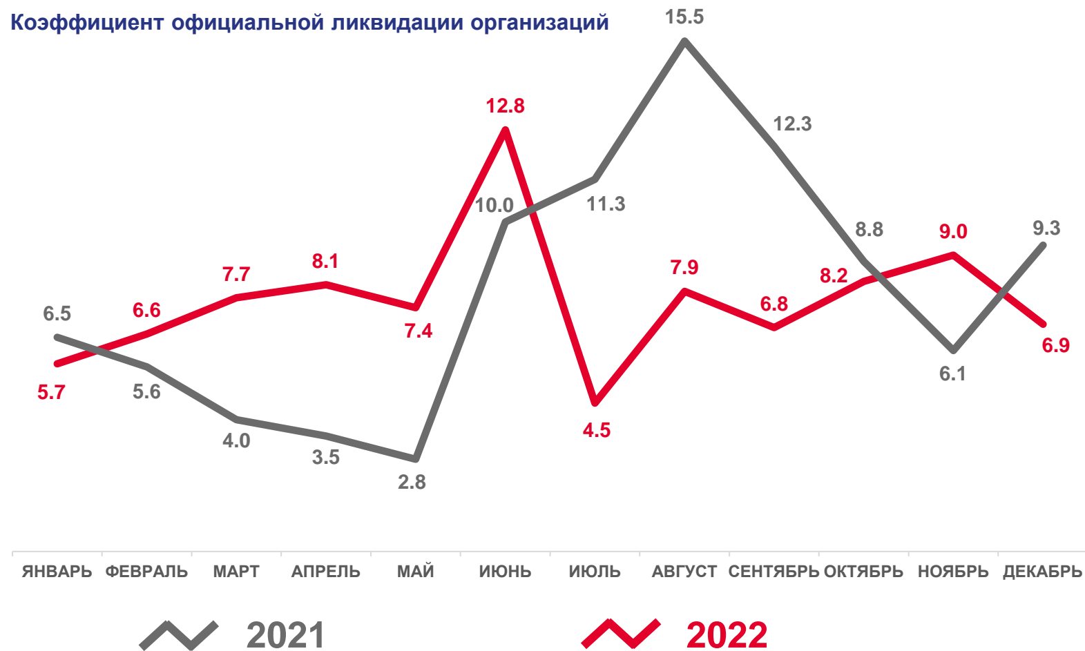
Коэффициент официальной ликвидации организаций